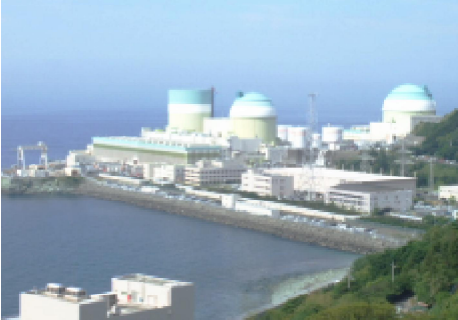
再稼働に向け準備の進められる伊方原発

「計画停電のお知らせへガキによる不安を解消せよ!」の要求では、「最大電力は過大に、供給力は過