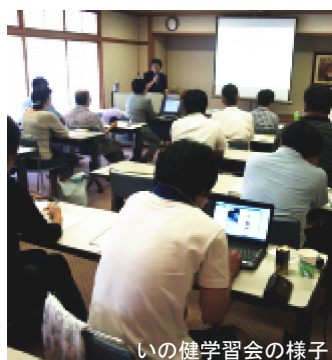
いの健学習会の様子

の故障があった場合とし、「実施の可能性は低い」と認めました。の停滞を打破する突破口にしようと呼びかけ、閉会しました。