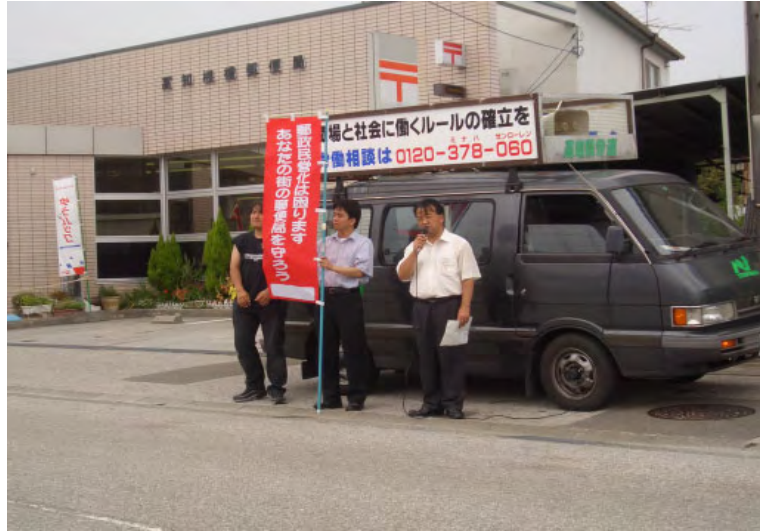
(7/29 檜橋郵便局長に要請した後、局前で宣伝)